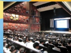
水戸市民会館 大ホール

『「志村フロイデグループ」の地域に溶け込んだ取り組みを紹介した。地域包括ケアシステムを念頭に置いた地域活性化プロジェクトやコミュニティカフェの設置、買い物支援などの事例を挙げながら、「中小病院は地域と運命共同体」と強調した。』『2022年度から始まった新カリキュラムにおいて求められている地域包括ケアシステムに対応できる看護師養成について、同グループの看護学校の実践例を説明。地域活動への参加などによって、多くの学生が訪問看護や地域の人の暮らしに興味を持ったとし、「看護教育が変わっていくことが求められている」と語った。』