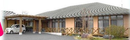
社会福祉法人 博友会 フロイデ総合在宅サポートセンター城里

WORK 勤務7年目。介護業務に加えリハビリ支援や体操指導にも携わり、現在は登録者数110名のデイサービスでご利用者様やご家族からの相談に応える『頼れる介護の専門家』です。